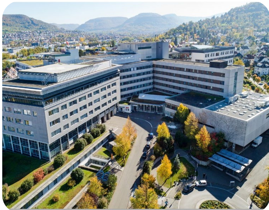
Klinikum am Steinenberg Reutlingen